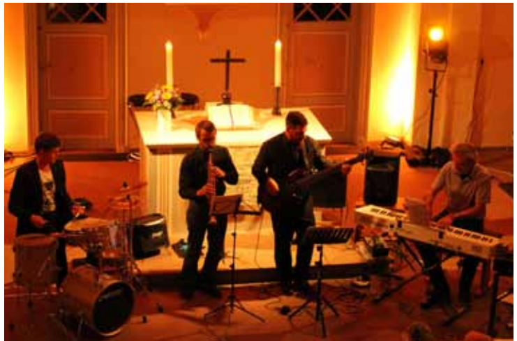
Die Jazz Angels in Aktion